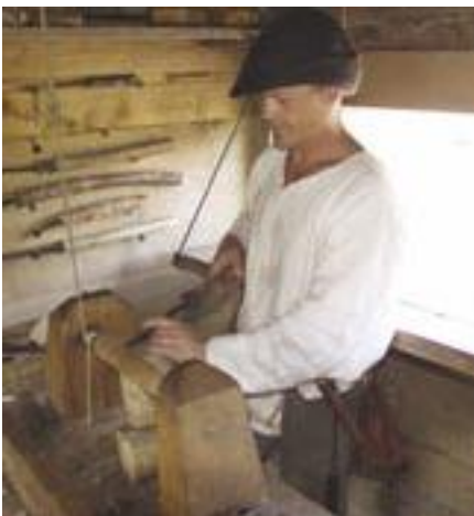
Ishuset, plattenslagerhuset, håndbærkerboden. Kært barn har mange navne. Lugen bag tømreren bør ikke være der.

Ildstedet bør flyttes over i nordøsthjørnet og en lysluge - eller et lille vindue - placeres der, hvor der nu fejlagtigt er indsat en dør. Ombyg-