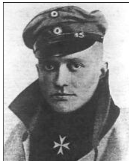
"Hauptmann von Richthofen, den "Røde Baron" - en sand ridder med 500 års forsinkelse..."

Allerede hér er der en tydelig parallel til middelalderens riddere. Jagerflyveren er individualist par excellence – en enkelt mand i et fly, overfor en modstander der kæmper på præcis samme vilkår. Teknologisk var krigens parter nogenlunde jævnbyrdige (ganske som rustninger og våben i middelalderen mere