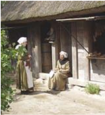
Skomagerhuset. Lugen til venstre skal lukkes, man har ikke panoramavinduer i midaldertiden.