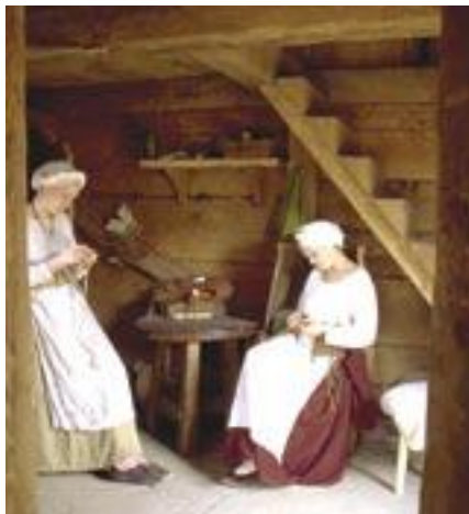
Farverhuset mens det stadig havde en trappe til loftet i stuen. Kvinden sidder, noget upassende, i mandens stol med ryglæn.