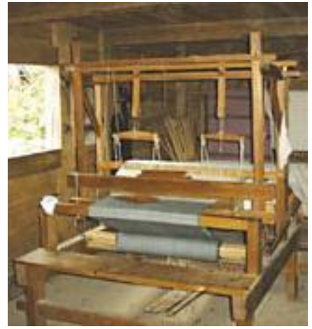
Væverhuset. Ud over den store luge på billedet er der nu kommet endnu en vinduesluge.

ningen vil ske efterhånden, som der bliver tid og mulighed herfor.