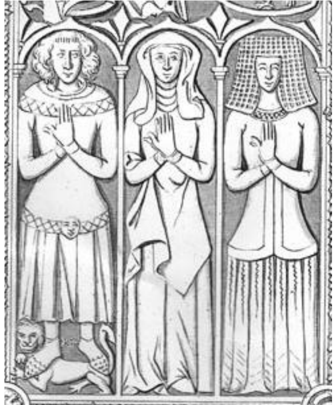
Fig. 5 Aftegning af Moltke's gravmæle af Abildgaard, ca. 1780. Tegning i Nationalmuseet.

dition er ofte af historikere overført til billedkunsten og billedkunstens kildemateriale.