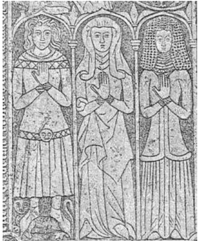
Fig. 6 Aftegning af Moltke's gravmæle af J. B. Løffler, ca. 1888. Tegning i Nationalmuseet.

På Møn i Keldby kirke, Danmark, findes bevaret en figurgravsten over medlemmer af familien Moltke fra omkring 1370. Randskriften angiver personernes identitet og levetid og er dermed en historisk skriftkilde til disse personer. Som objekt er gravstenen et kunstværk, der kan tolkes kunsthistorisk: stenen er som typisk