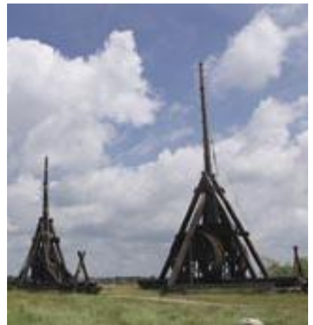
Bliderne, resultater af eksperimentalarkæologiske forsøg og forskning.

Eksperimentalarkæologi er nu langt om længe anerkendt som en videnskabelig forskningsmetode, ikke kun i Danmark, men i resten af Verden. Med denne metode kan man få et resultat som ikke beviser hvordan tingene egentlig var, men som gennem en række "trial and error" forsøg giver et "high possibility statement" om, hvordan de kunne have været. Metoden ligger til grund for de fleste af centrets rekonstruktioner af huse, skibe og krigsmaskiner foruden rekvisitter.