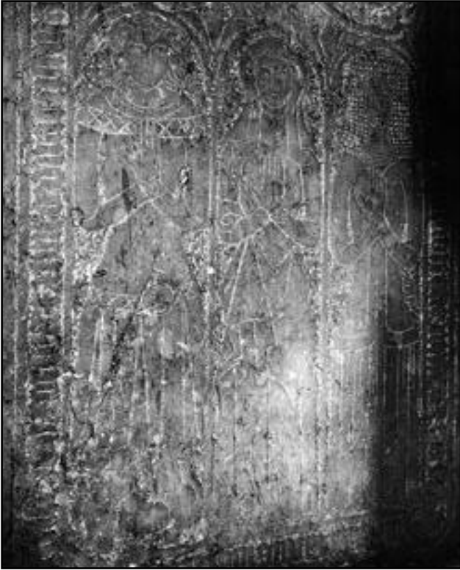
Fig. 4 Gravmæle over medlemmer af slægten Moltke i Keldby kirke, Møn, ca. 1370.