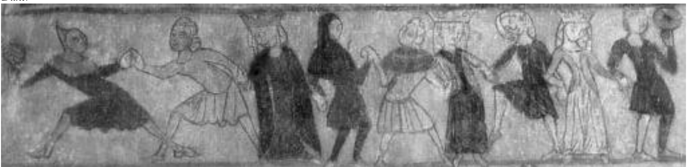
Fig. 3 Adelskvinder iført overdimensionerede kroner, sandsynligvis som understregning af deres fornemme stand. Kalkmaleri i Ørslev kirke, ca. 1350-60.

malet. Derimod kan ikke aflæses ud fra historiske og arkæologiske præmisser alene, om afbildede hætter tog sig præcis sådan ud, blev båret af mænd uanset stand eller af mænd som ham, der blev afbildet, her til må benyttes kunstvidenskabens analyser om motivvalg og tendens.