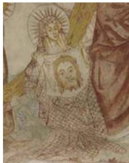
Fig. 1 Den hellige Veronika iført folderig, draperet dragt uden tydelige dragtdetaljer. Kalkmaleri i Viskinge kirke, ca. 1415.

Motivet skal analyseres ud fra ovenfor nævnte principper, sakrale motiver giver ofte afvigelser fra modedragten gennem en tilpasning til liturgisk dragt eller en forældning af dragten. Der kan også findes andre grunde til en forældning (historisering) eller fantasifuld omarbejdning af modedragten, f.eks. for tydeligt at understrege den afbildedes sociale, økonomiske eller lignende status. 5