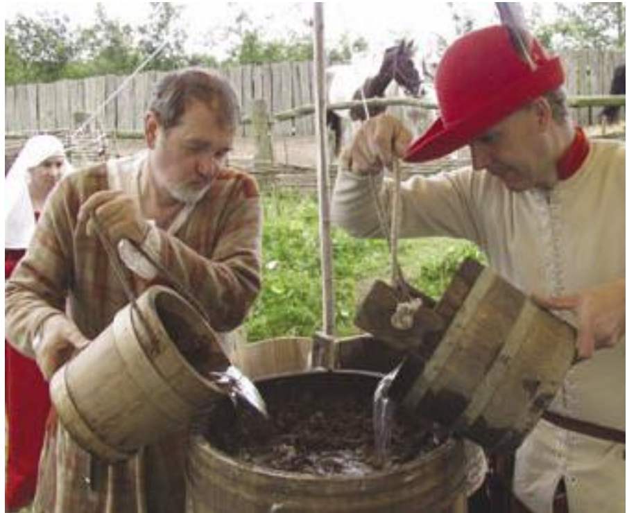
Making saltpetre at the Medieval Centre.

In 2004 members of the Group excavated about 1 cubic metre of the chicken shit material and attempted to extract saltpetre from it. The extraction process is done with water. A small hole is drilled in the bottom of a small wooden barrel and this hole is plugged up. The barrel is filled with the rotted manure and then water is added. The nitrates in the manure, which are very soluble, dissolve and after a few hours the plug is removed and the water drained out into a bucket. This process is repeated as many times as you have manure. The water containing the saltpetre is then put into an iron cauldron and boiled down to concentrate it. Once it has been boiled right down the water is