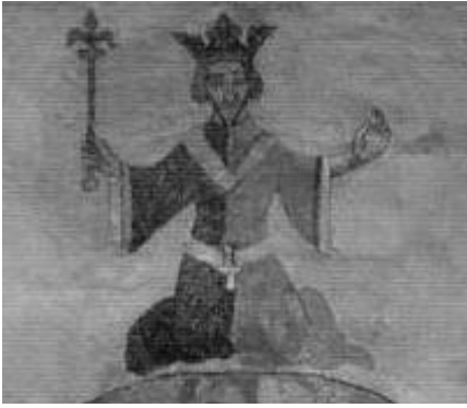
Fig. 2 Konge iført tve-farvet dragt i farverne grøn og gul. Kalkmaleri i Udby kirke, ca. 1380-1400.

historikeren, og at det primært er inden for fagene arkæologi og historie at en billedfremstillings objekter har tolkningsværdi. Ud fra et kunsthistorisk synspunkt er hovedinteressen samlet omkring det kunstneriske udtryk, teknikker anvendt til fremstillingen, epoken billedet er fremstillet i, billedsprog m.m., med andre ord: gengivelsen belyst i en kunsthistorisk kontekst. Det er imidlertid ofte uden for kunsthistoriens interesse at beskæftige sig med det afbildedes konfigurationer, det afbildedes "ord" og tegn for bestemte objekter og genstande. 7