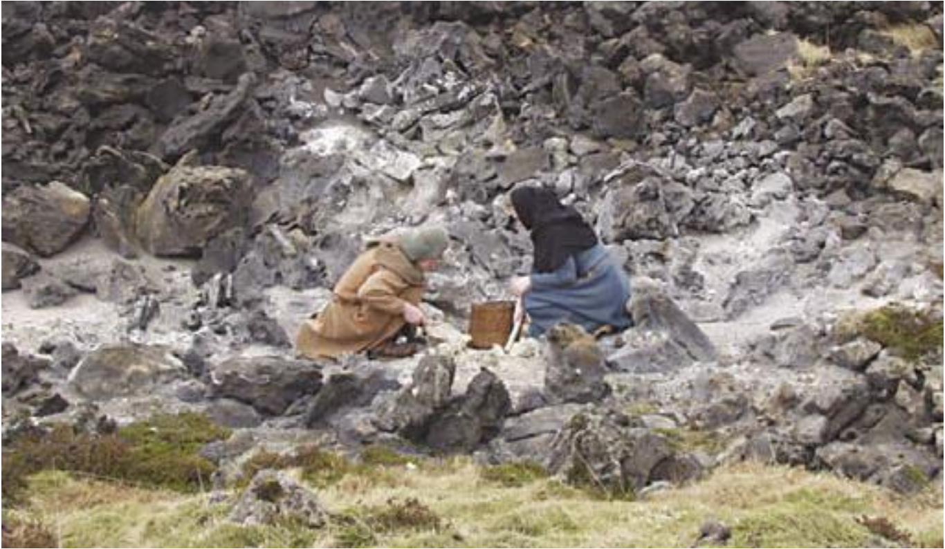
Gathering sulphure in Iceland.

used at the Middelaldercentret to make the charcoal. In the medieval period, sulphur was obtained from volcanic areas of Europe, primarily Sicily and Iceland. A team from the Group travelled to Iceland in 2001 and again in 2005 to collect raw sulphur ore. It was purified in a simple way by just heating it till it melted, skimming off the impurities that rose to the surface and pouring the molten sulphur through a piece of coarse cloth into a small mould. Once cold it was ground up in a pestle and mortar.