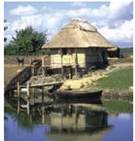
Fiskerhuset. Ja, det hed det engang, men fiskeri var faktisk ikke et erhverv, så derfor rejste fiskeren og rebslageren flyttede ind!