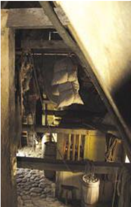
Lagerbygningen på Nokken der nu skal være en egentlig købmandsgård for en ny, lille købmand.

Eller mange flere. For vi bliver jo – heldigvis – hele tiden klogere.