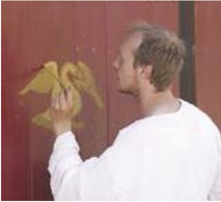
Fint tilhuggede egeplanker males og dekorerer.