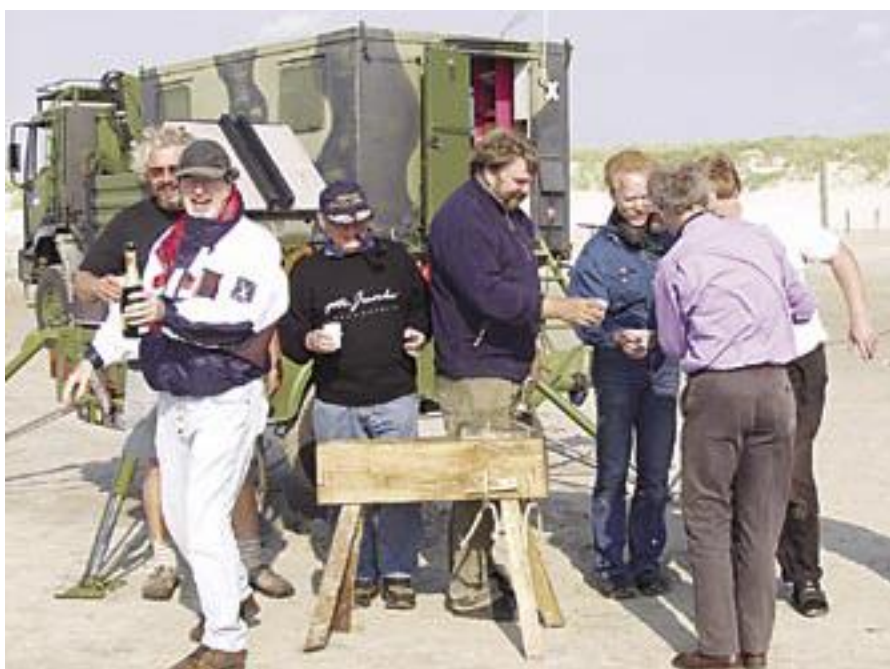
The Ho Group celebrating on the training areas of the Danish army at Oxboel beach 2003. The village Ho lies nearby, therefore the name: The Ho Group.

Since these beginnings, much has been published on the subject. What has always been difficult to determine however is just how powerful early artillery was and just how effective a weapon it could be. In order to answer these questions, about 10 years ago, a number of researchers started to make full-scale replicas of early cannon and conduct live firing trials. Using high speed photography and modern radar equipment to track the path of the projectile, their work has been very useful in showing just what these early cannon were capable of. However in all these trials modern gunpowder has had to be used. Modern gunpowder is of course made from pure materials in a very highly controlled way to produce the best possible material. But what did medieval gunners use? Was medieval gunpowder the same as our modern examples and if not just how did it differ? It is very likely, for example, that the ingredients were not so pure as those we use today. Medieval sources are silent on these particular problems and in order to answer them the only way forward is to make gunpowder using as far as possible the methods and techniques used by the medieval gunpowder maker and try it out under experimental conditions. No easy task. And this is where the unique facilities and skills of the Middelaldercentret are so important. Starting in 2002 an interna-