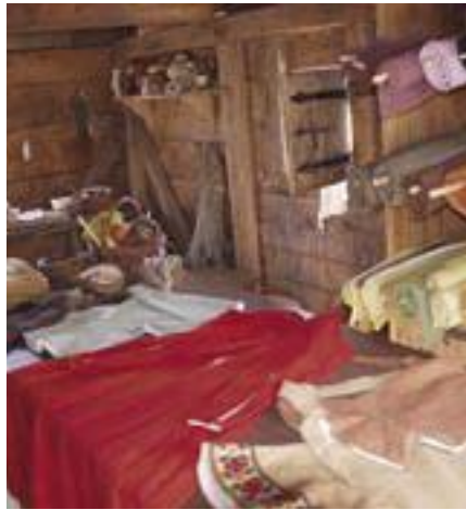
Skrædderhuset mangler en forstue.